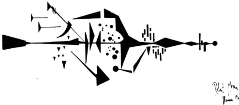
Robert Moran, Four Visions (extrait), 1963