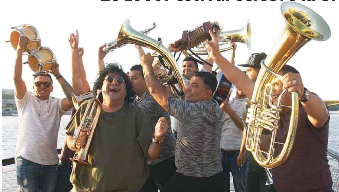
Boban Markovic Orkestar sera à l'affiche le vendredi soir.

EPALINGES • Le 1066Festival et ses artistes vont à nouveau faire voyager le public à travers leur musique, leurs messages et leur volonté de transmettre une énergie chaleureuse, lors de cette neuvième édition, qui aura lieu les 29 et 30 septembre à la salle de spectacles d'Epalinges.