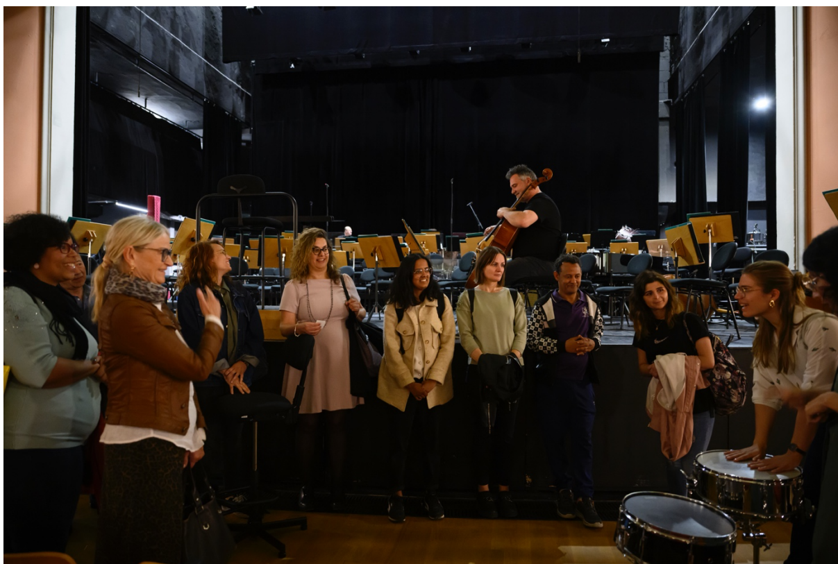
Salle Métropole, Lausanne, 23.05.2024