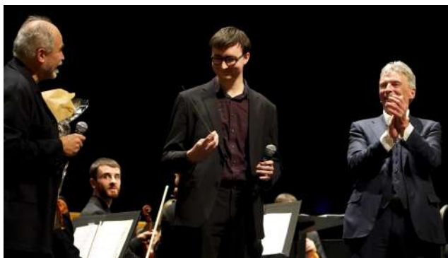
© Julie Dekimpe ; Cyprien Lengagne

Accueil classe de l'Ecole de Musique de Lausanne (EML)