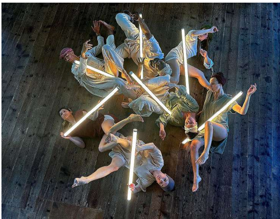
Pour marquer ses 30 ans, le No Square Quartet est entouré notamment par la compagnie de danse ADN Dialect.