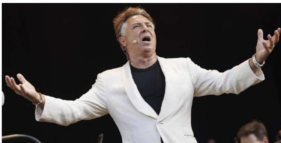
Paléo Festival Nyon, 28.07.2024, Roberto Alagna