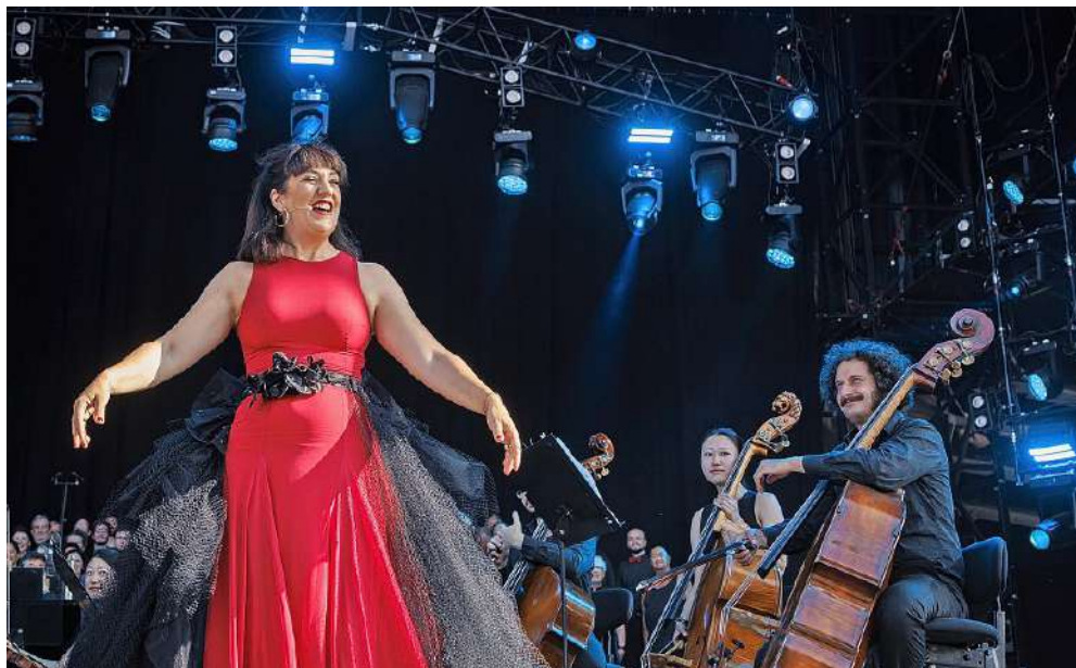
Marina Viotti, la plus barock'n'roll des chanteuses suisses, aime faire le show, comme ici lors du dernier Paléo Festival.

Je n'ai jamais le trac. J'aurais plus une énorme excitation. Il y avait tellement d'improvisation avec les intempéries, les feux d'artifice, les flammes, les serpents. Je n'étais