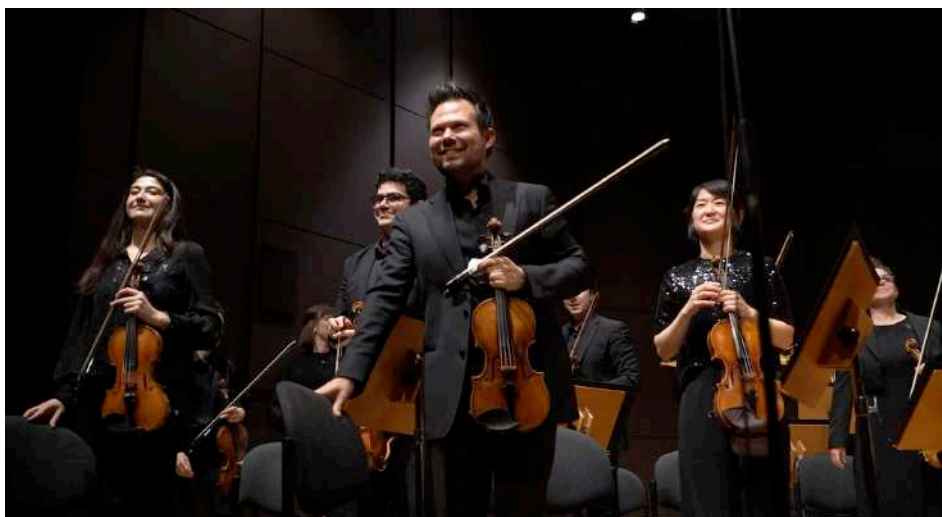
Lausanne, Salle Paderewski, 13.02.2025